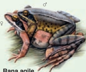
Rana agile Rana dalmatina