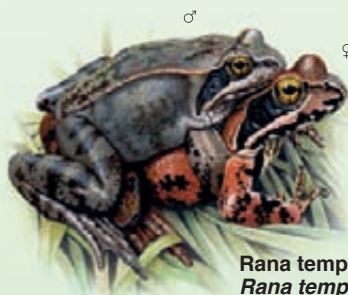
Rana temporaria Rana temporaria