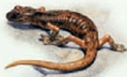
Geotritone italiano Speleomantes italicus