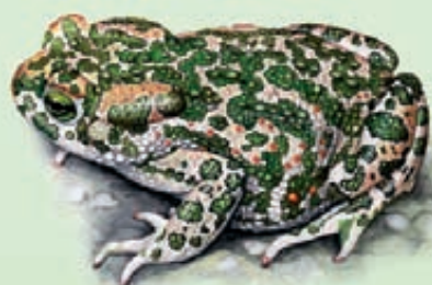
Rospo smeraldino Bufo lineatus