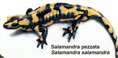
Salamandra pezzata Salamandra salamandra